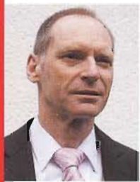
Von Roger Odenthal, Köln

Unternehmensstrukturen und Behördenapparate passen oft nicht zusammen, vor allem wenn es zu Ermittlungen bei Wirtschaftsdelikten kommt. Ermittlungsstellen stützen forensische Untersuchungen in der Regel auf eine vergleichsweise gut strukturierte und durch Zuständigkeiten sowie Anweisungen geregelte Ordnung – eine Situation, die es in der freien Wirtschaft so nur selten gibt. Diese Unterschiede haben Folgen.